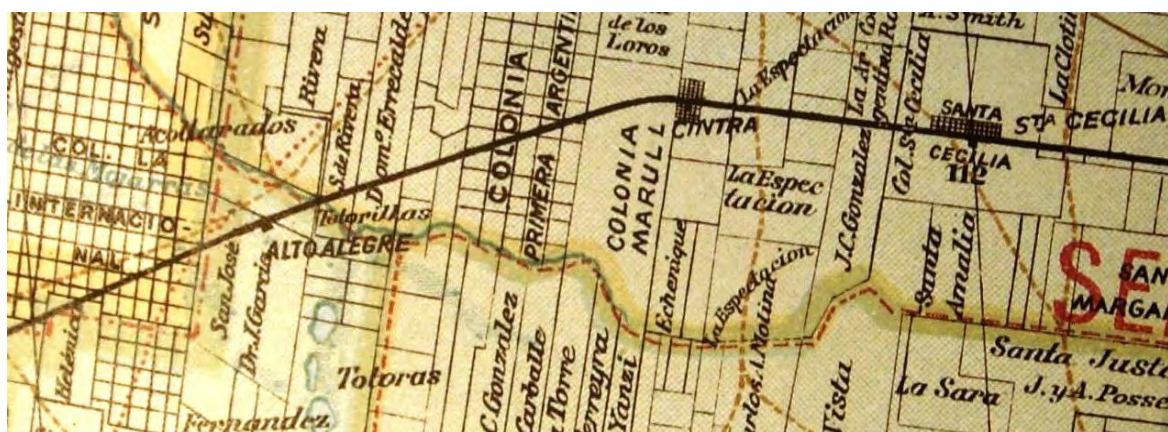
La sección oeste del renglón As según los mapas Laberge 1867 y Córdoba 1924.