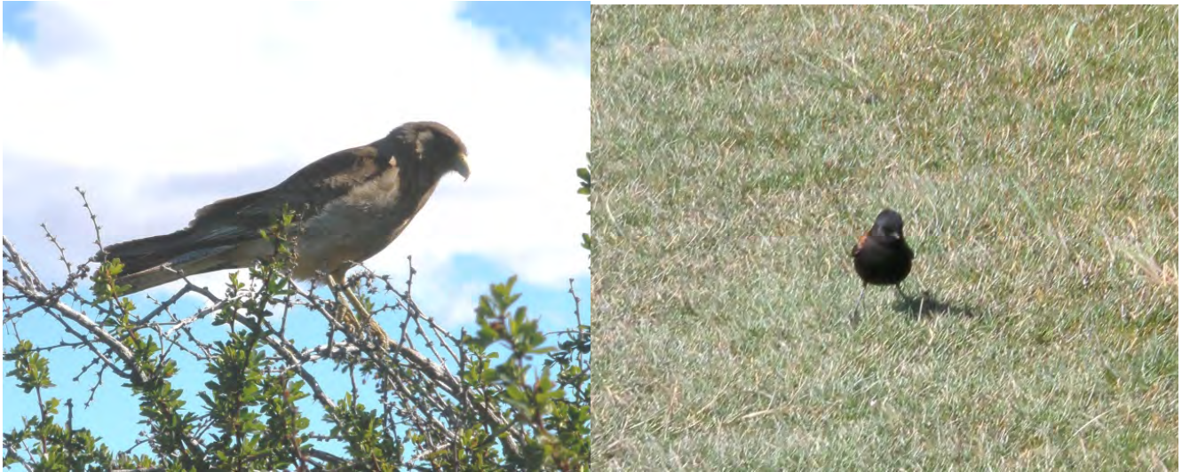
Chimango, Milvago chimango , ubicuo rapaz pampeano y sobrepuesto, Lessonia rufa , tiránido visitante invernal desde la Patagonia.